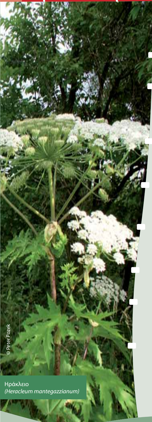
Ηράκλειο ( Heracleum mantegazzianum )