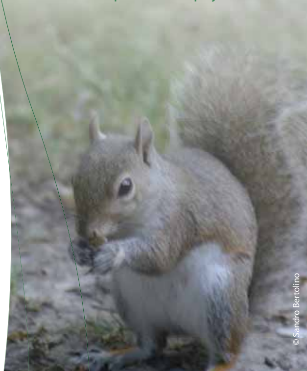
Γκρι σκίουρος ( Sciurus carolinensis )