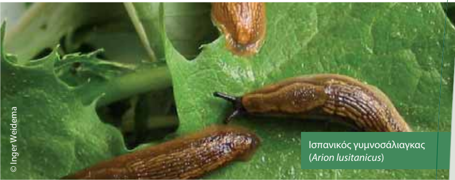
Ισπανικός γυμνοσάλιαγκας ( Arion lusitanicus )